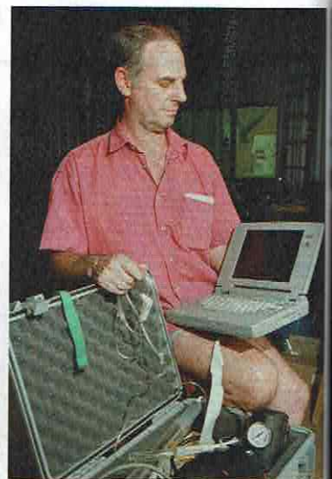
'Mijn eerste euthanasieën voerde ik uit met de Deliverance Machine , een laptop die de patiënt zélf kon bedienen.'

Maar strikt gezien vallen die mensen niet onder de euthanasiewet, dus artsen die hen uit compassie toch willen helpen om te sterven, zien zich verplicht om de wet te omzeilen, ofwel door bewust een foute diagnose te stellen, ofwel door illegaal te euthanasieren. Dat gebeurt jammer genoeg heel vaak, en dat vind ik erg. Het zou veel beter zijn om de wet uit te breiden, want wie zijn wij om een 'voltooid leven' geen goede reden