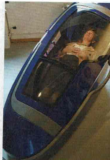
'Als ik in België het gebruik van de Sarco zou aanbieden, zou ik daarvoor vervolgd worden.'

»Ik hoop natuurlijk dat de Sarco ook individueel verkocht zal worden. De plannen ervan zullen overal ter wereld via onze website gedownload kunnen worden, waarna ze als basis kunnen dienen om de Sarco met een 3D-printer te bouwen. Ik schat dat de