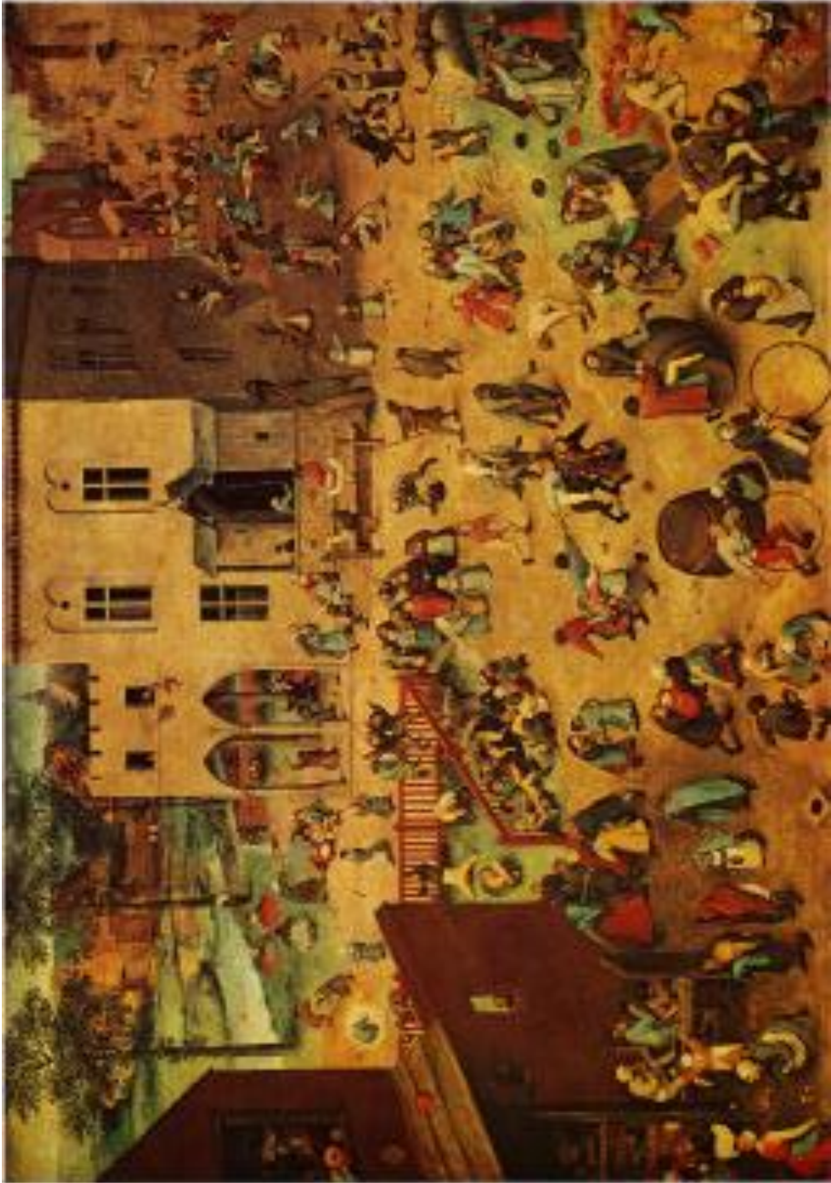
bron: lesmap Pieter Bruegel