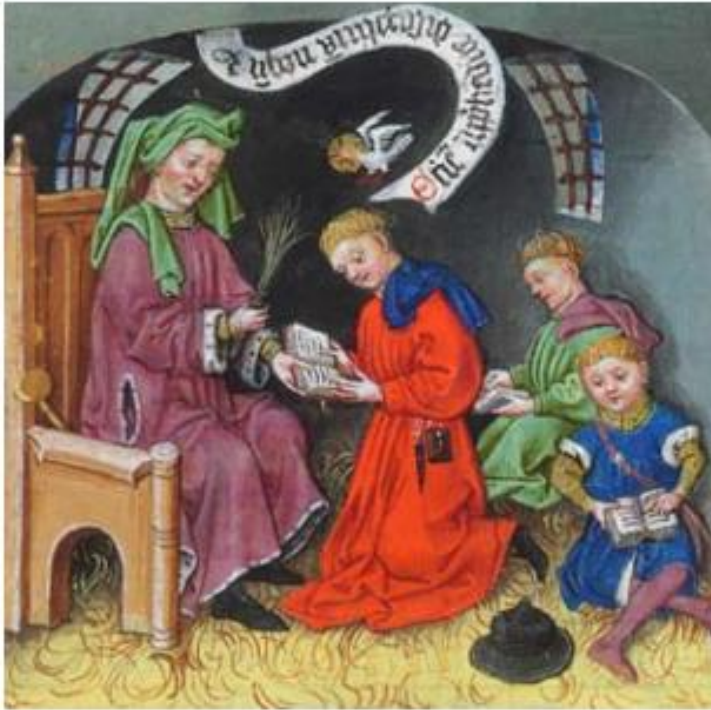
Afbeelding 1: De abdijschool