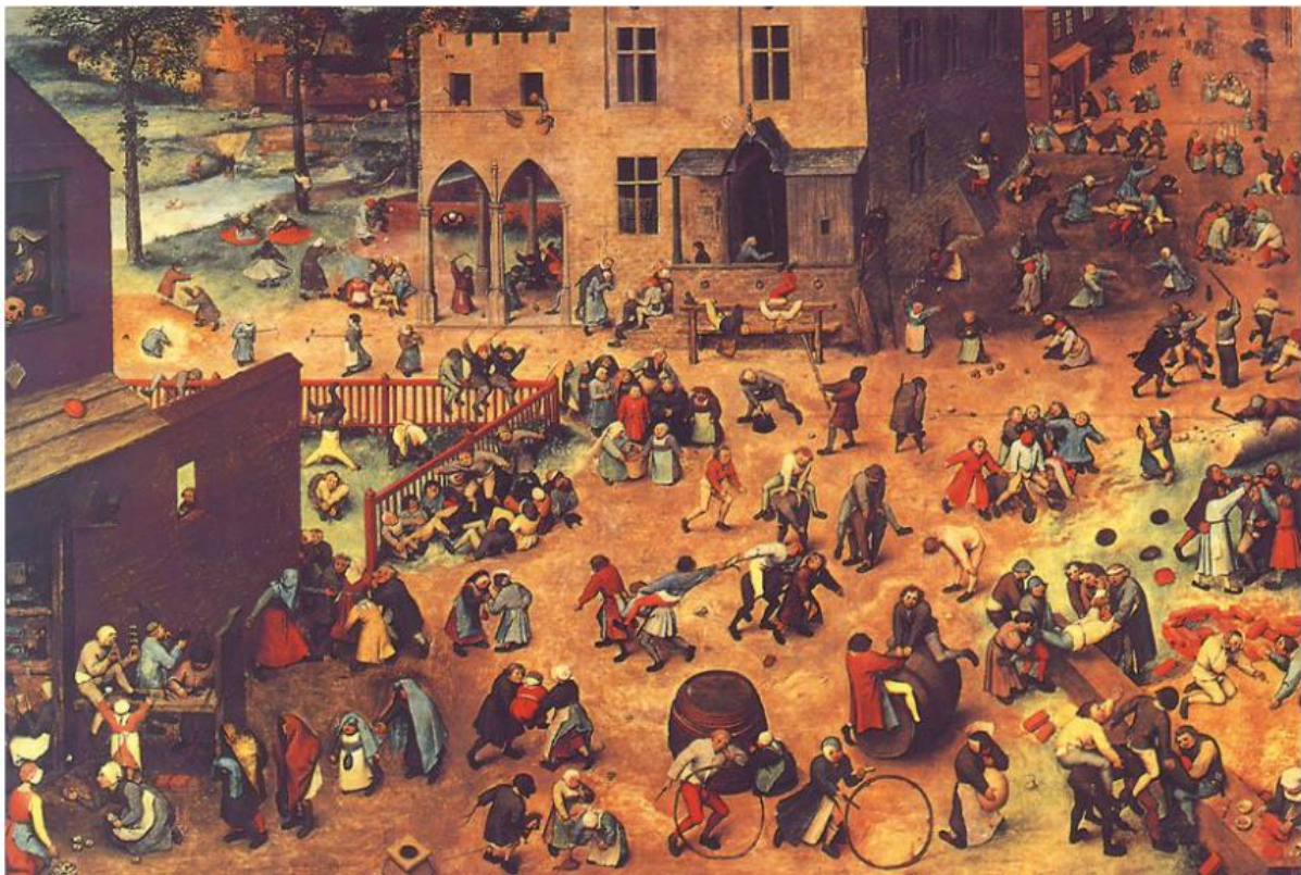
Figuur 1 Kinderspelen van Pieter Bruegel de Oudere, 1560