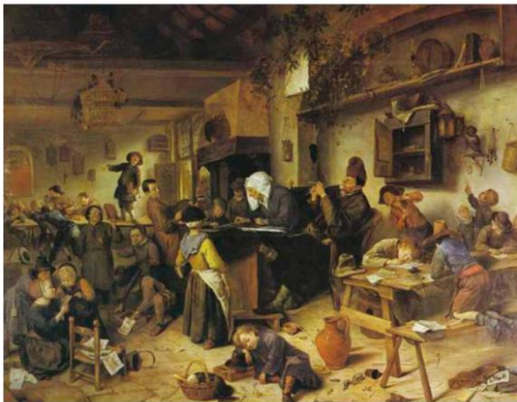
Afbeelding 2: Schilderij 'De dorpschool' (Jan Steen, 1670)